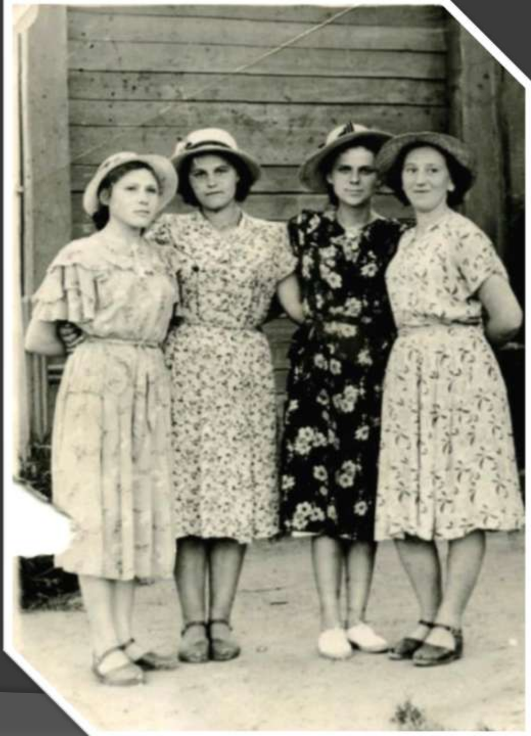
С подругами. 1956 год.