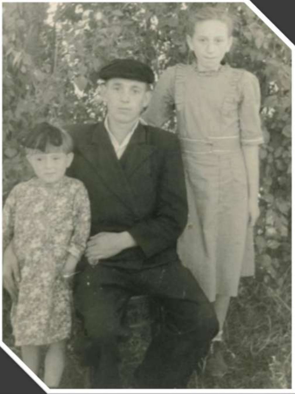
В кругу семьи. 1951 год.